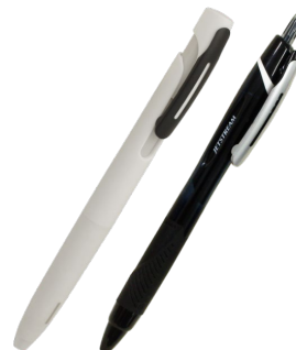
対応ボールペン 取付けイメージ

『クリップタフナー01』は大手文具メーカー（ゼブラ・三菱鉛筆）の単色ボールペンに対応した、樹脂クリップ補強用カバーです。普段お使いのボールペンに『クリップタフナー01』を取付けることで樹脂クリップの破損を防止し、クリップ保持力を強化することができます。