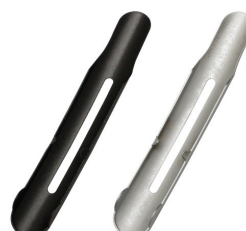
クリップタフナー01 本体（裏面）