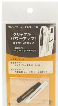
クリップタフナー01 品番：CT-01-MBKMS

株式会社トーキンコーポレーション（本社：東京都葛飾区）は、市販のボールペンの樹脂クリップを強化する専用補強カバー「クリップタフナー01」を2024年6月17日（月）より販売開始しました。