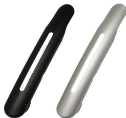
クリップタフナー01 本体（表面）